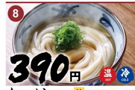
8 かけ 並 390 大 540 A simple dish of Udon in delicate umami broth. Green onions. 热汤面 凉汤面 / 가계우동