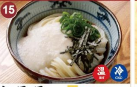
15 とろろ 並 500 大 650 Less broth type dish. Grated yam, green onion, nori. 山藥汤面 / 도로로 우동