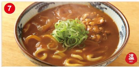
7 牛肉カレーうどん 並 670 大 820 Udon topped with Japanese beef curry of Welsh onions. 牛肉咖喱乌冬面 / 소고기카레우동