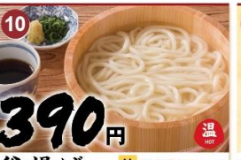
10 釜揚げ 並 390 大 540 Hot udon noodles with some of the hot cooking water, served with hot dipping sauce. 锅煮素面 / 따뜻한 살은 우동