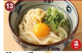
13 釜玉 並 500 大 650 Brothless type dish. Boiled udon topped with raw egg yolk, green onion. 生鸡蛋拌面 / 달걀우동