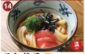
14 明太釜玉 並 620 大 770 Less broth type dish, bodied udon topped with mentaiko sauce, nori. 明太魚子生鸡蛋拌面 / 명간달걀우동