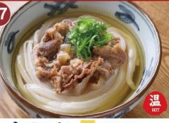
17 牛肉うどん 並 680 大 830 A simple dish of Udon in delicate umami broth topped with beef. 牛肉汤面 / 소고기우동