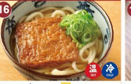
16 きつね 並 490 大 640 A simple dish of Udon in delicate umami broth topped with seasoned fried tofu. 油豆腐汤面 / 기스네(유부)우동