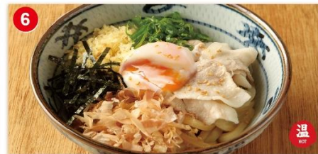
6 濃厚 豚まぜ讃岐 並 720 大 870 brothless type udon. Pork, soft boiled egg, nori, fried tempura batter bits, dried bonito flakes, green onions. 猪肉鸡蛋拌面 / 돼지고기 달걀우동