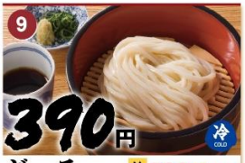
9 ざる 並 390 大 540 Cold udon in straining basket accompanied with dipping sauce. 爪寒面 / 자루우동