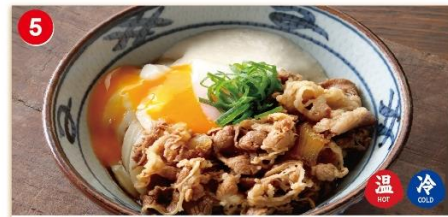
5 牛肉 とろろ玉 並 840 大 990 less broth type dish of udon. Beef, grated yam and soft boiled egg. 牛肉山藥鸡蛋拌面 / 소고기 마 달걀우동